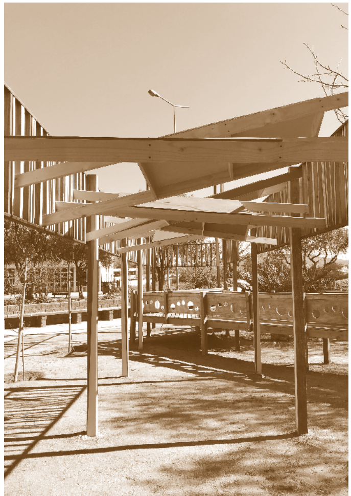
Fig. 3. Intervención del Taller de Arquitectura.