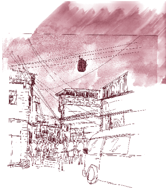
Figs. Favela Complexo do Alemão.

Principalmente en Latinoamérica, esta realidad, por décadas, ha determinado la relación entre las áreas formales y las zonas informales de la ciudad, y consecuentemente, una buena parte de las interven-