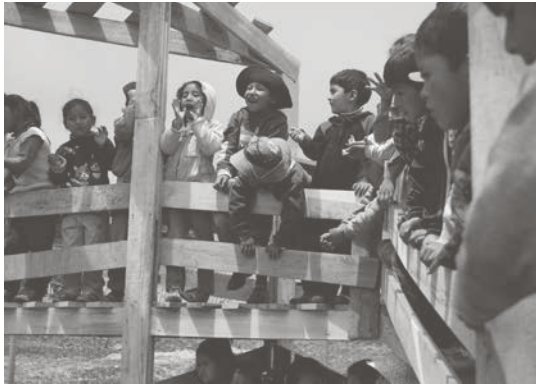
2. Niños asistentes a la inauguración de la obra de Travesía.