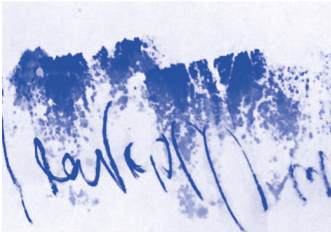
↑ Teresa Montero, croquis de cerro bajo la lluvia (detalle), tinta china negra, 2013, 12 X 12 cm

En el dibujo con tinta y pincel las cualidades de lo líquido están en acto, la simultaneidad de pensamiento y dibujo entra en una especial tensión; por ejemplo, la tensión de una gota que en el extremo de la hoja que la sostiene, se acumula hasta que su liquidez la hace caer; se mueve por su propia estructura fluida. En el dibujo con tinta y pincel es un continuo mo-