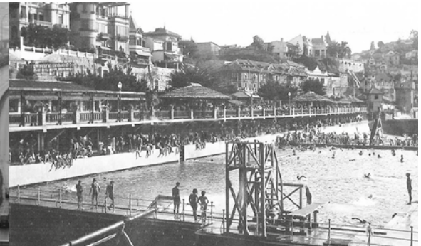
Piscina de Recreo en 1931. Actualmente un muro reemplazó la playa.