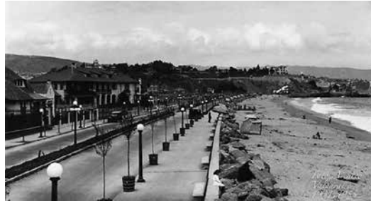
Avenida Perú en 1930.

Se busca un elemento arquitectónico, habitable, para generar lugar y espacio público. Espacio en el ir y en el estar. Una nueva costanera marítima, que genere un mar calmo, en este caso para la recreación y el ocio, propias del borde costero: el baño, los deportes náuticos, la movilidad fluvial, la preservación y cuidado de la arena. Acaso el elemento mas propio