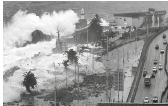
Temporal 2015, Curva los Mayos.

En la ciudad contemporánea, el Espacio Lugar, portador durante siglos del sentido de habitar juntos, se ha ido transformando en Espacio de Flujo Automóvil y en No-Lugares. (Escudero, 2017)