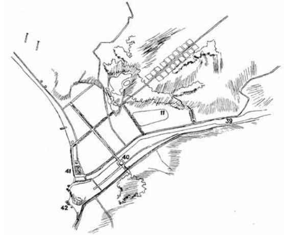
Proyecto de Achupallas (Fundamentos de la Escuela de Arquitectura UCV, 1971).

Valparaíso reconquista su destino por la circulación (Cruz, 1954, lam. 12).