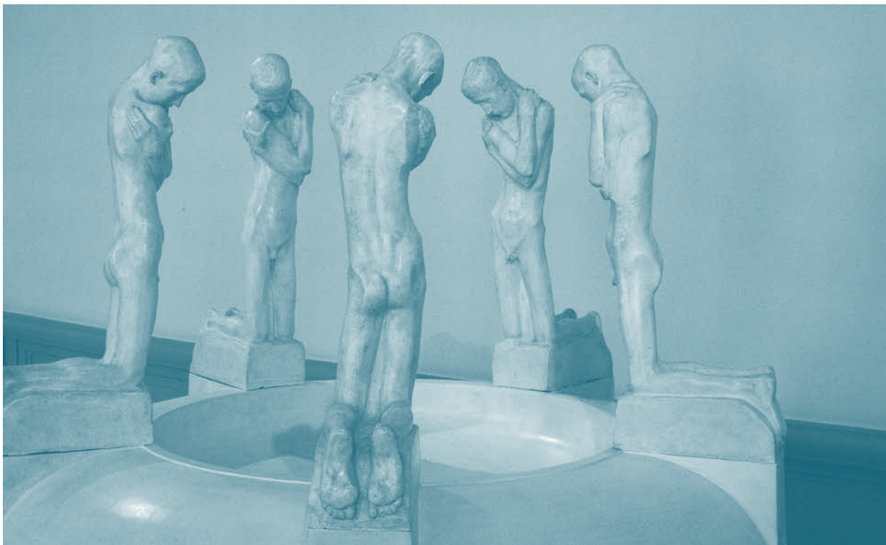
Figura 7. Fountain with Kneeling Youths (1898), de George Minne, escultura en yeso.

y en sus esculturas la masculinidad aparece en crisis. Aunque no se trata exactamente de Apolos, uno de sus motivos recurrentes fueron jóvenes adolescentes desnudos que parecen estar abstraídos de su entorno, que bien pueden ser leídos como la versión humana de esa deidad solar.