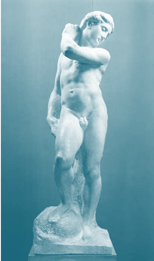
Figura 5. Apolo o David Apolo (1530), de Miguel Ángel, escultura de mármol.

definitivamente su indignación heroica 5 y son capaces de mostrarnos y ocultarnos al mismo tiempo algo suyo. Uno de los más enigmáticos ejemplos es el Apolo de Miguel Ángel (figura 5), que exagera su contrapposto en un giro pronunciado sobre su propio eje, al punto de que hace serpentear cualquier verticalidad. Además de incitarnos a recorrerlo, el Apolo de Miguel Ángel pareciera ser consciente del recurso del desplazamiento del eje como una reserva. Si bien nos invita a recorrerlo, hay una porción de su intimidad de la que como espectadores jamás seremos parte: su brazo izquierdo oculta el lugar que ocupa su corazón.