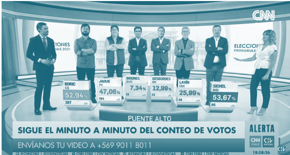
Figura 1. Transmisión televisiva de la actualización de votos de las primarias presidenciales del 18 de julio de 2021.

de su jerarquía para actualizar su vigencia. 2 Es a la luz de su definición que me pregunto si formalmente el mandato de la masculinidad podría traducirse a la rectitud que encarnan los cuerpos de los hombres, en especial en quienes aspiran al control.