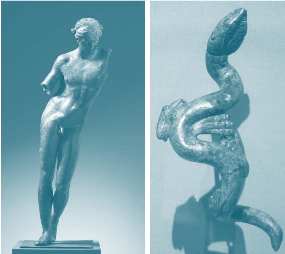
Figura 4. Apolo de Cleveland (Cuarto siglo antes de nuestra era), atribuida a Praxíteles, escultura de bronce.

gravedad para mostrarse suspendidos en una curva pronunciada que forma un arco entre sus torsos y el otro elemento que compone la estatua, el tronco de un árbol a sus costados.