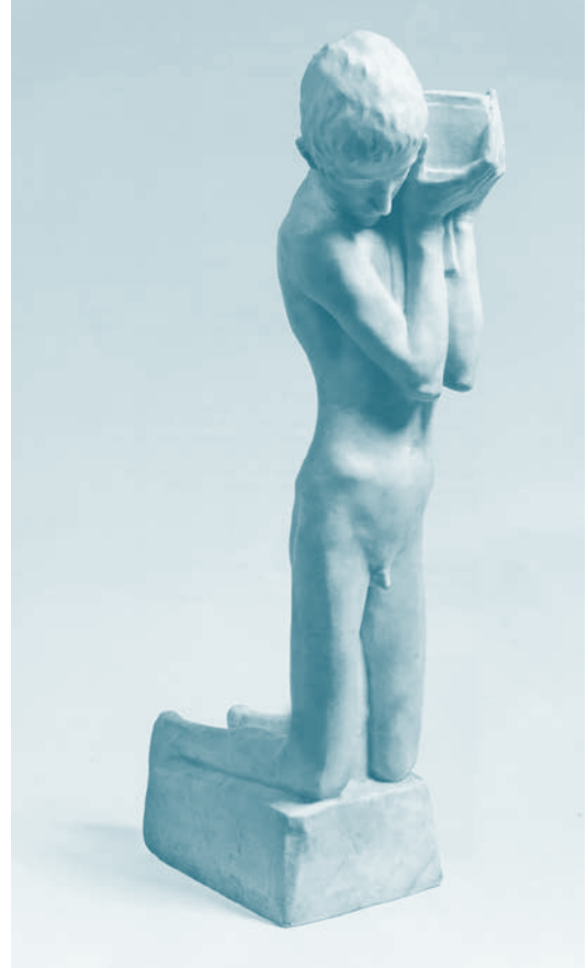
Figura 6. The Relic Bearer (1987), de George Minne, escultura en mármol.

y nos priva de conocer lo que lo hace humano. En su capítulo dedicado a los Apolos, Kenneth Clark arma una genealogía de estatuas que avanzan en el tiempo desde la Antigüedad al Renacimiento, manteniéndose siempre desnudos, con gestos "sosegados y solemnes", 6 pero como él mismo afirma: los mitos no mueren sino que atraviesan un largo período de retiro y luego regresan. Propongo ver en la obra del escultor belga George Minne (1866-1941) una recuperación tardía de la figura de Apolo, esta vez desprendida de cualquier heroísmo y monumentalidad.